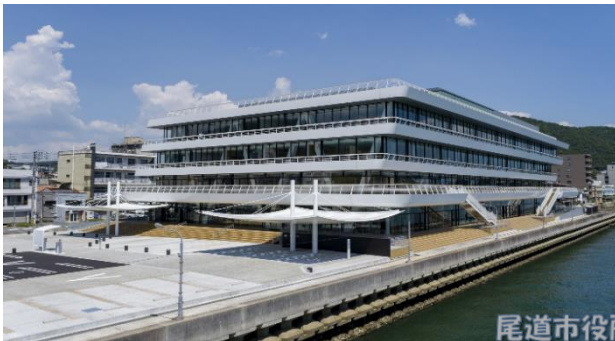
尾道市役所 本庁舎